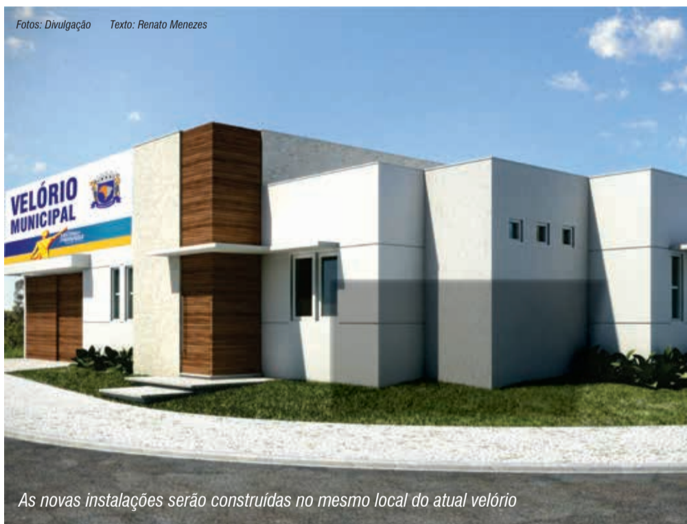
As novas instalações serão construídas no mesmo local do atual velório