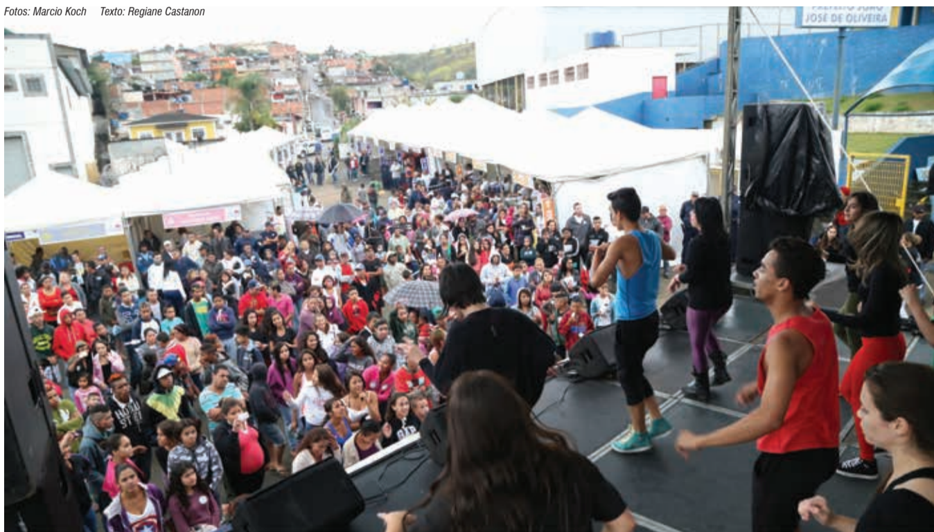
O mau tempo não desanimou o público presente que pode conferir no dia, diversas atrações musicais, como o grupo Shekinah Company

Texto: Regiane Castanon