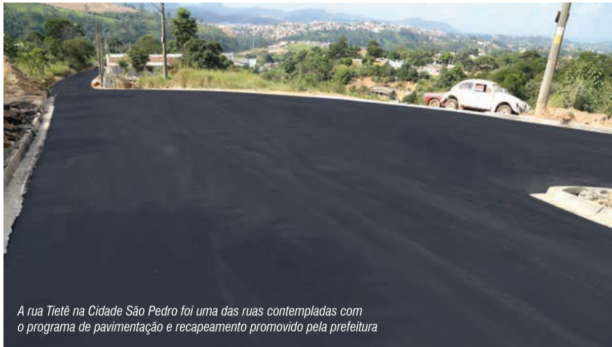
A rua Tietê na Cidade São Pedro foi uma das ruas contempladas com o programa de pavimentação e recapeamento promovido pela prefeitura

Texto: Renato Menezes