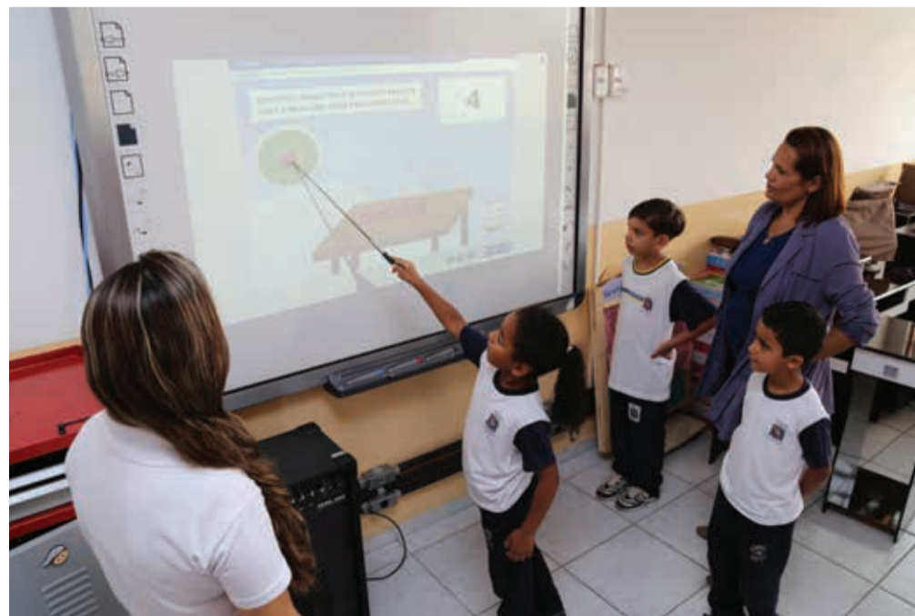
Alunos participam das atividades do Portal de Aulas na lousa digital