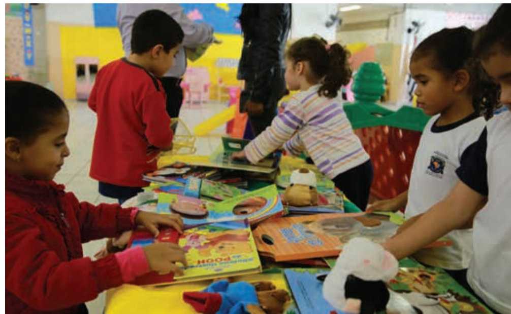
A prefeitura adquiriu mais de 19 mil livros infantis que vão ajudar no desenvolvimento da intelectualidade e condição motora da criança