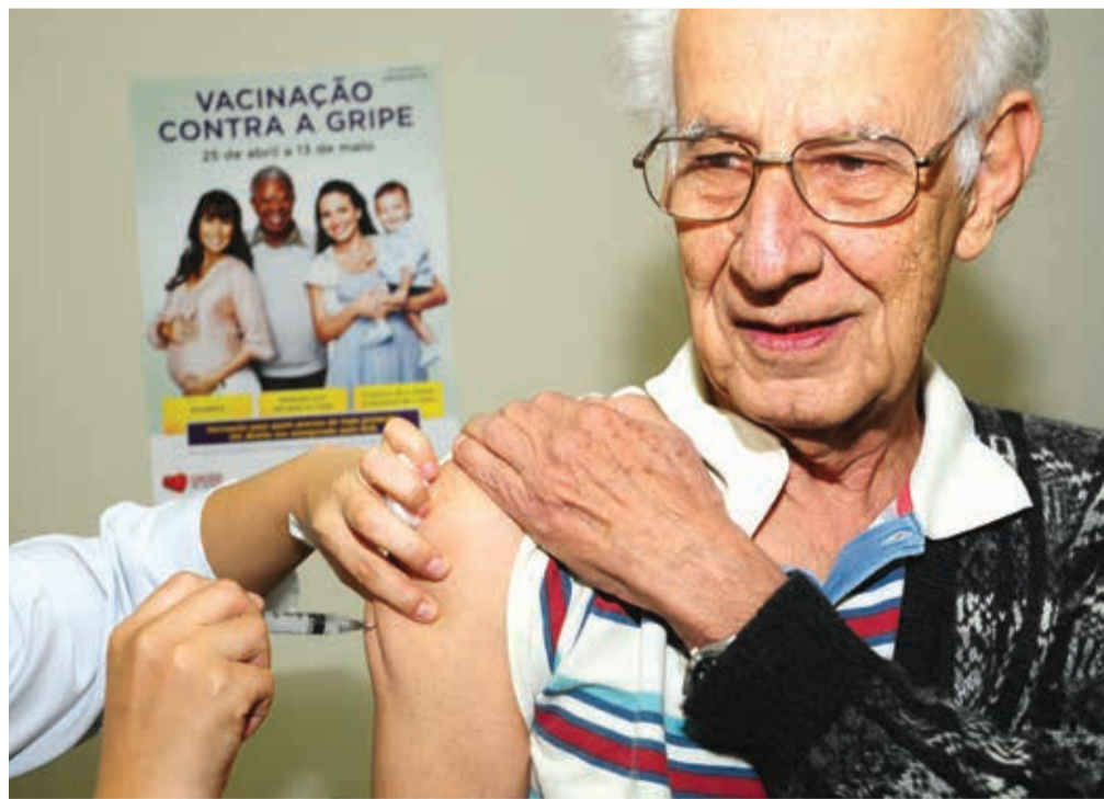
Prazo para vacinação contra a influenza H1N1 termina na próxima sexta-feira (30/05) e quem ainda não tomou a vacina deve procurar a unidade de saúde mais próxima do seu bairro ou entrar em contato no telefone (11) 4622-8863