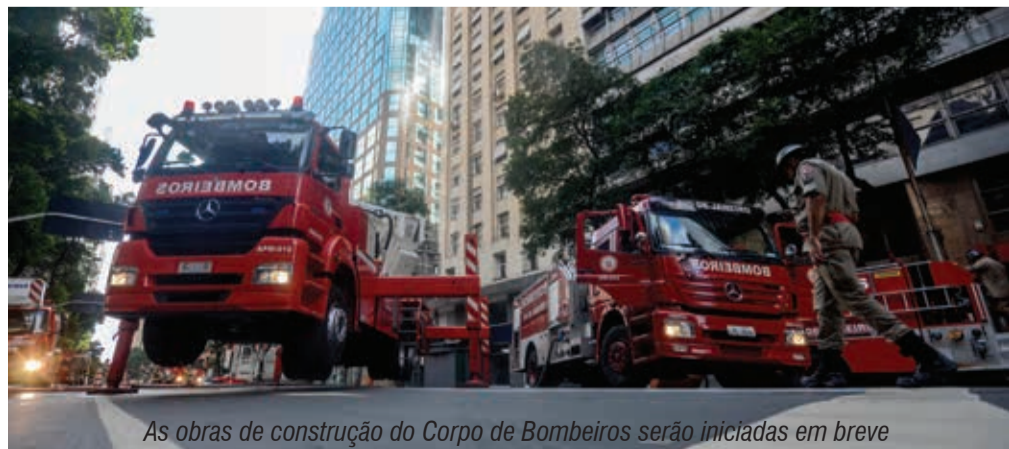
As obras de construção do Corpo de Bombeiros serão iniciadas em breve