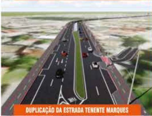
DUPLICAÇÃO DA ESTRADA TENENTE MARQUES