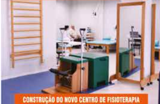
CONSTRUÇÃO DO NOVO CENTRO DE FISIOTERAPIA