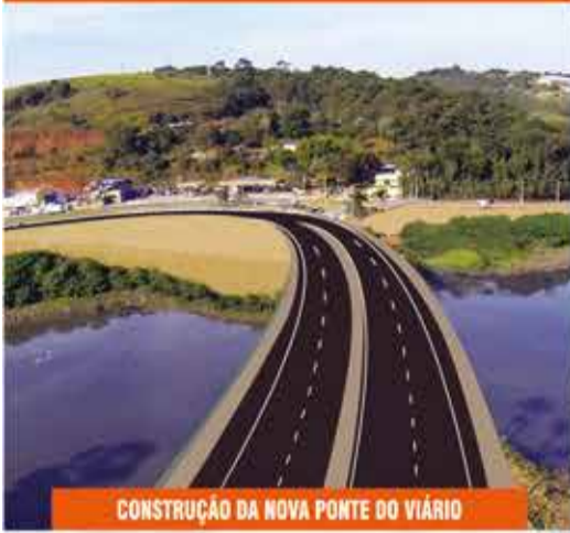
CONSTRUÇÃO DA NOVA PONTE DO VIÁRIO