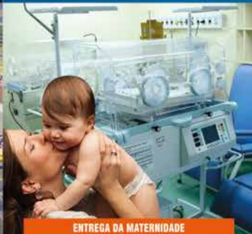
ENTREGA DA MATERNIDADE