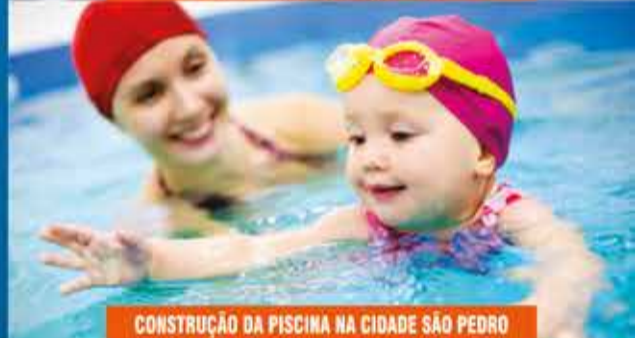
CONSTRUÇÃO DA PISCINA NA CIDADE SÃO PEDRO