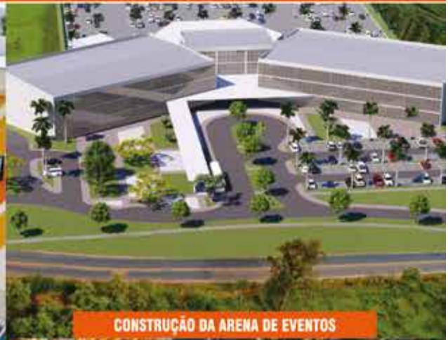
CONSTRUÇÃO DA ARENA DE EVENTOS