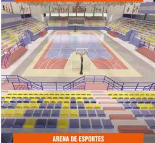
ARENA DE ESPORTES