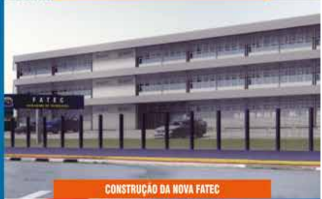
CONSTRUÇÃO DA NOVA FATEC