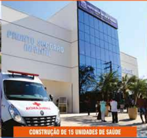
CONSTRUÇÃO DE 15 UNIDADES DE SAÚDE