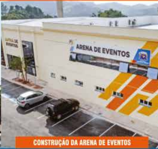
CONSTRUÇÃO DA ARENA DE EVENTOS