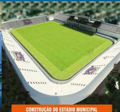
CONSTRUÇÃO DO ESTÁDIO MUNICIPAL