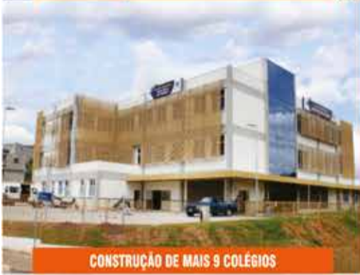
CONSTRUÇÃO DE MAIS 9 COLÉGIOS