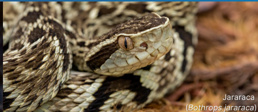
Jararaca ( Bothrops jararaca )

Se por acaso encontrar uma serpente em trilha, apenas se afaste cuidadosamente do animal, contornando o mesmo ou retornando pelo caminho que veio.