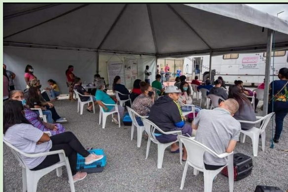
Bairro 120 (346 castrações)