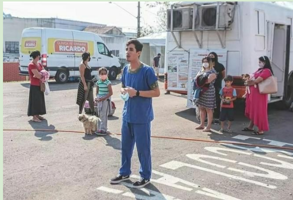
Jd São Luis (325 castrações)