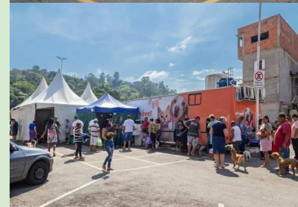
Cid. São Pedro (469 castrações)