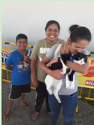
FEIRA DE ADOÇÃO PQ. TIBIRIÇÁ (maio 2022)