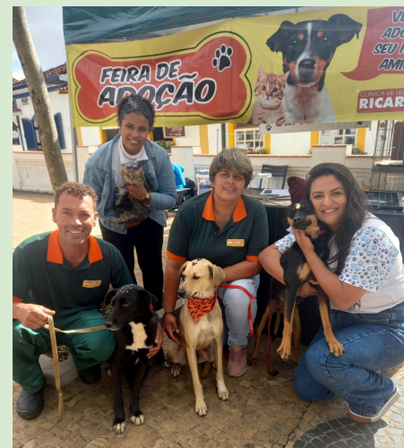
FEIRA DE ADOÇÃO CENTRO (junho 2022)